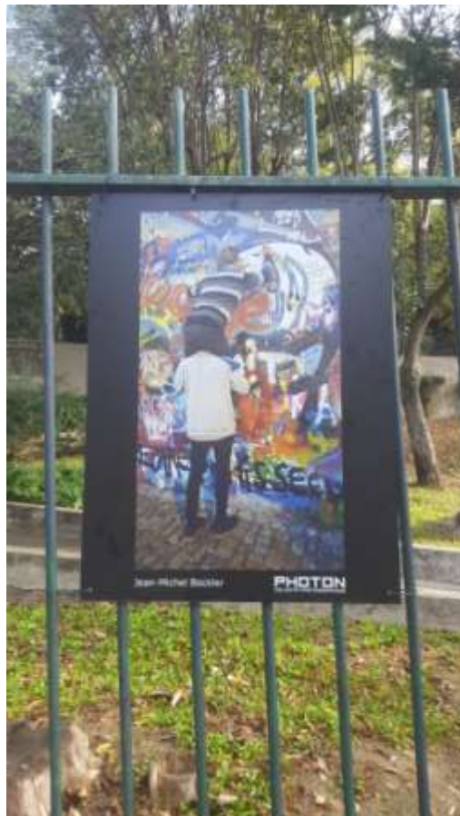
« Être Urbain », Maison de l'environnement, Nice, novembre 2021