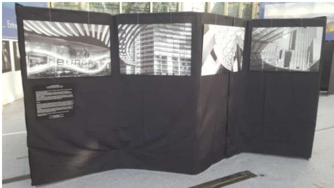
Déclics Niçois, Nice, Parc Phoenix, décembre 2021