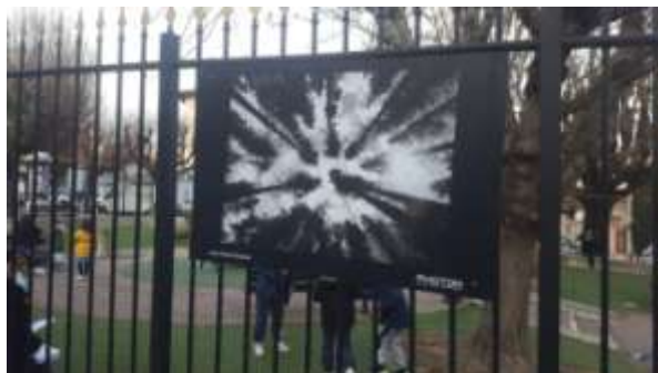
« Les vertiges de la forêt », Square Goiran, Nice, février 2021