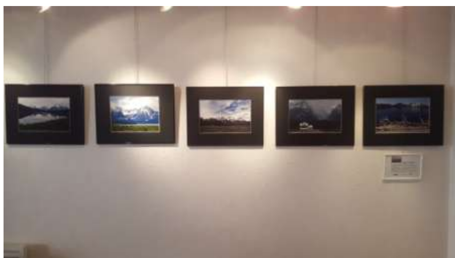
« Nature sauvage – Au cœur de l'Amérique », Roquebillière, février 2021