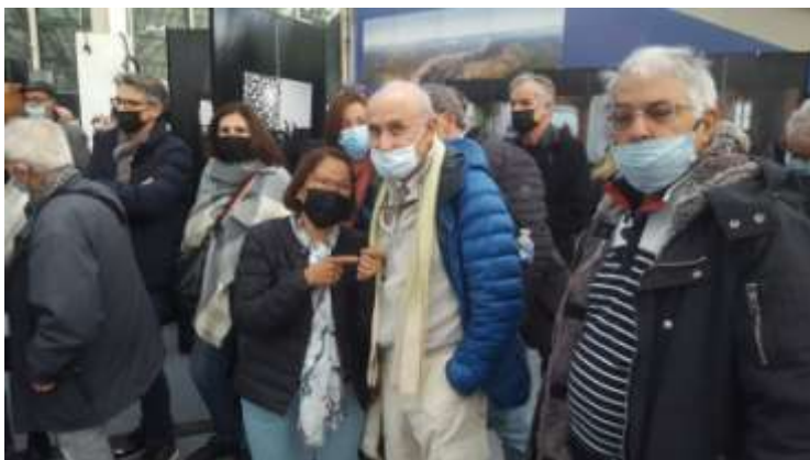
« Street Photographie », Objectif Image Nice, Déclics Niçois, Parc Phoenix, Nice, décembre 2021