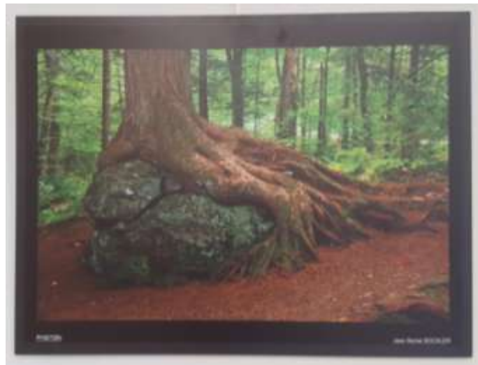
« Festival de la Photo de Nature », Maison de l'environnement, Nice, mai 2021