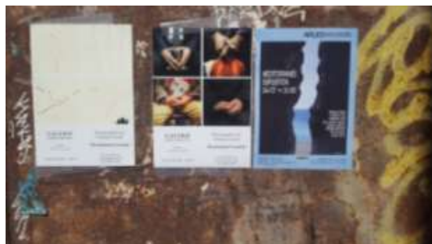
« Méditerranée », Espace d'exposition Art et Gourmandise, Arles, juillet 2021