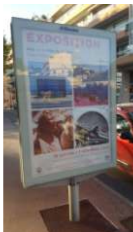
« Le monde d'aujourd'hui en Noir & Blanc », Galerie d'art, Menton, mai 2021