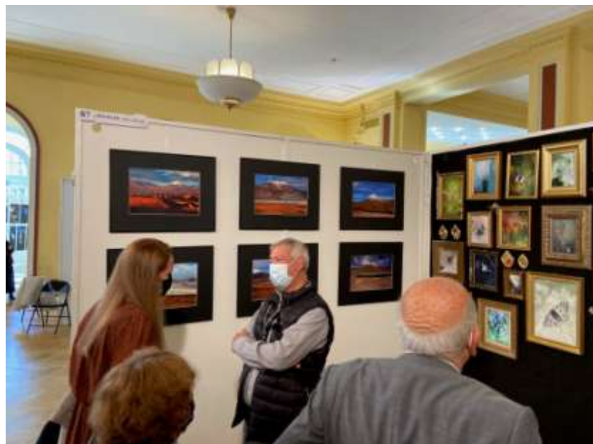
« Le désert d'Atacama (Chili) », PhotoMenton, novembre 2021