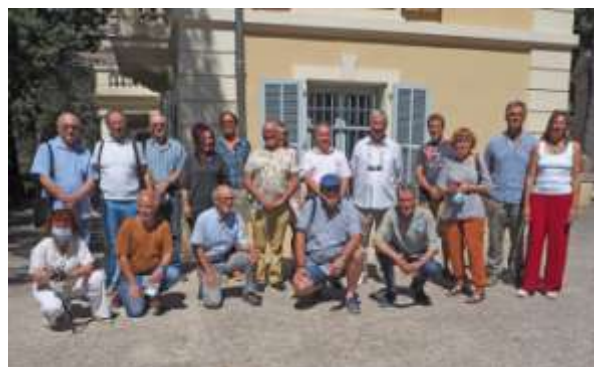
« Festival de la Photo de Nature », Maison de l'environnement, Nice, mai 2021