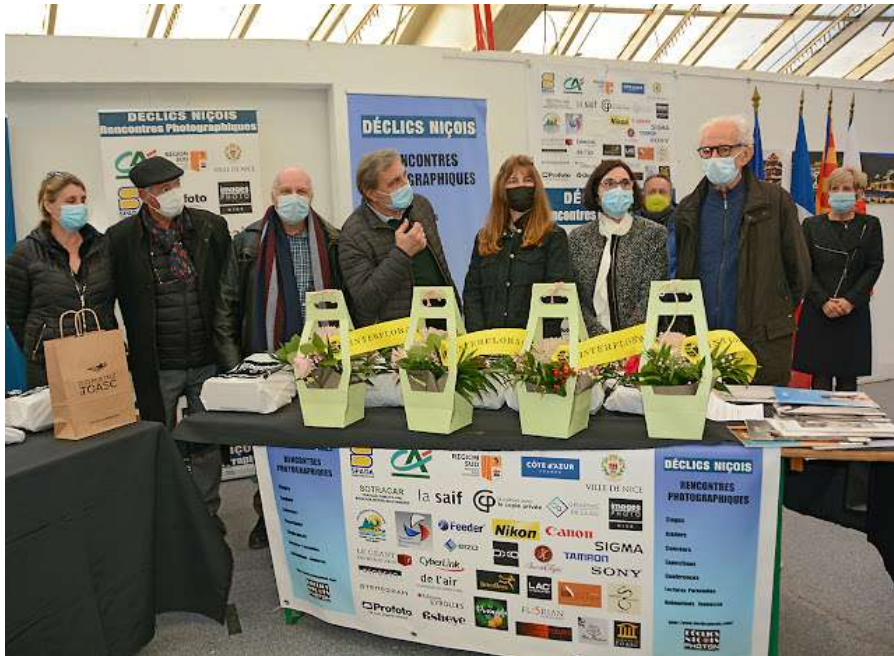
Déclics Niçois, Nice, Parc Phoenix, décembre 2021