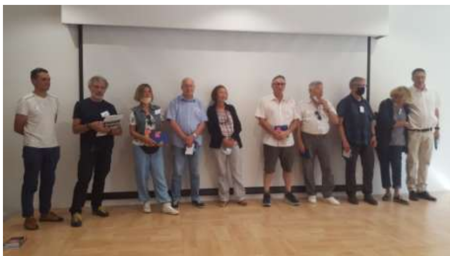
« Chili (Torres del Paine) », Photos – Rencontres, St Sauveur sur Tinée, juillet 2021