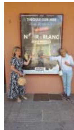
« Noir & Blanc », Espace culturel, Théoule, mai 2021