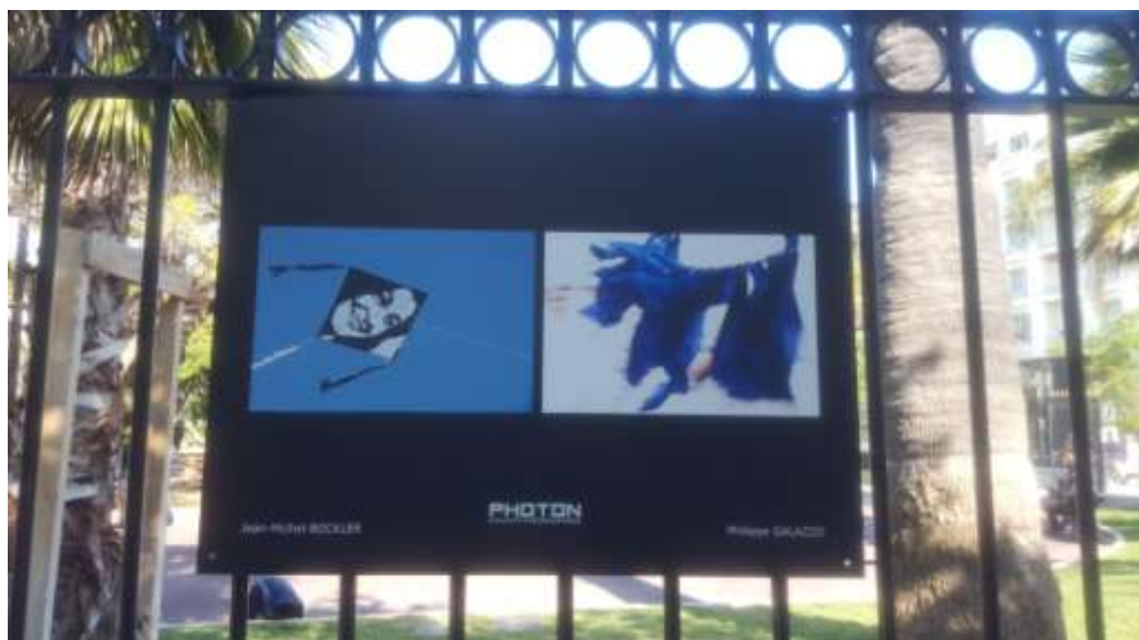
« Domino », Jardin Alsace Lorraine, Nice, avril 2021