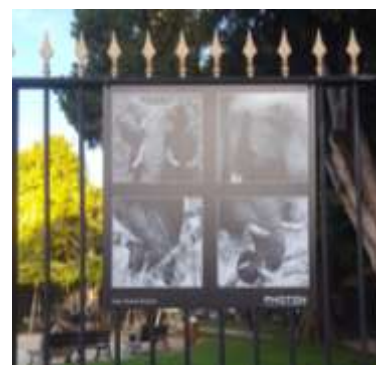
« 4X4 Nature », Villa Thiole, Nice, septembre 2021