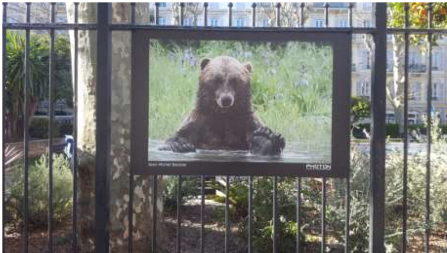
« Festival photographique de Nature », Jardin Durandy, Nice, mars 2021