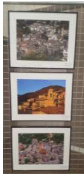
« Villages de montagne des Alpes-Maritimes », Objectif Image Nice, Photos – Rencontres, St Sauveur sur Tinée, juillet 2021