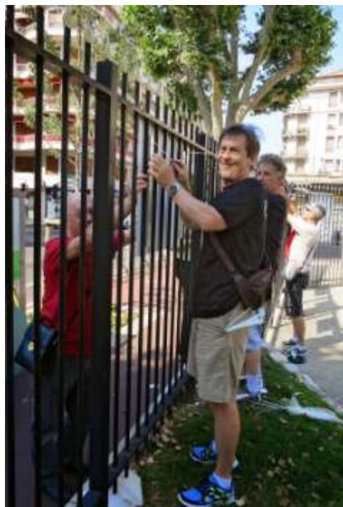
« Parenthèse Verte », Jardin Alziary, rue de la Buffa, Nice, juin 2014