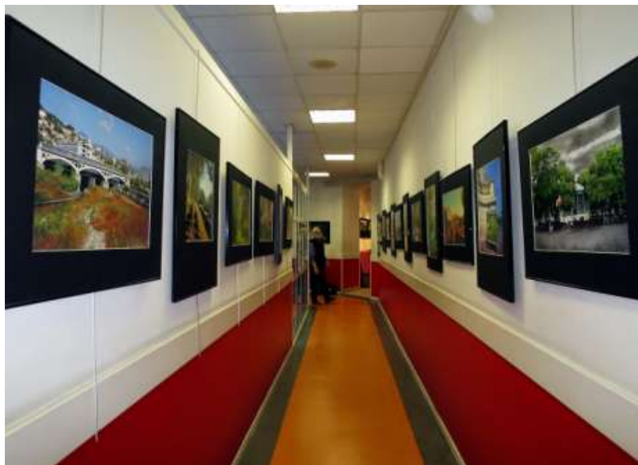
« Parenthèse Verte », CAL Notre-Dame, Nice, avril 2014