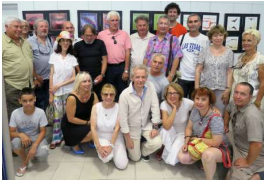
« 4X4 », Médiathèque de Contes, juillet 2014