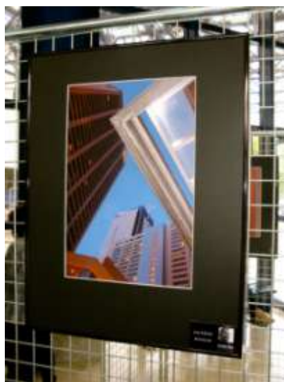
« Urban City », Gare du Sud, Nice, juin 2014