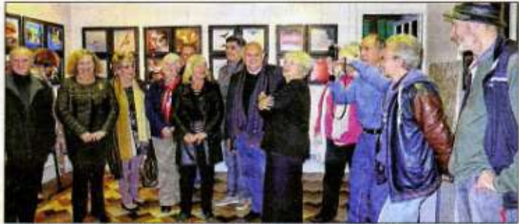
Les visiteurs ont apprécié l'originalité de la présentation et la qualité des photographies.

Que ce soit pour illustrer un écho, une dissonance, une opposition ou bien pour raconter une histoire, ces quatre carrés forment ensemble un véritable