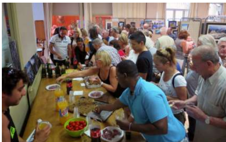
« Photos Rencontres », St Sauveur, juillet 2014