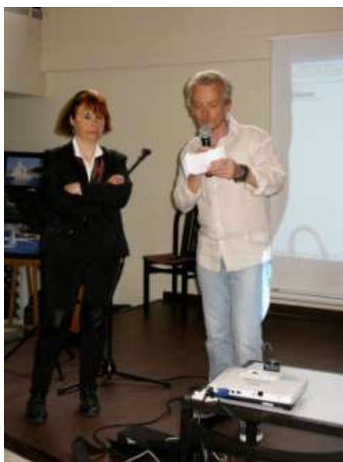
« Musigraphie », Forum Nice-Nord, Nice, mai 2014