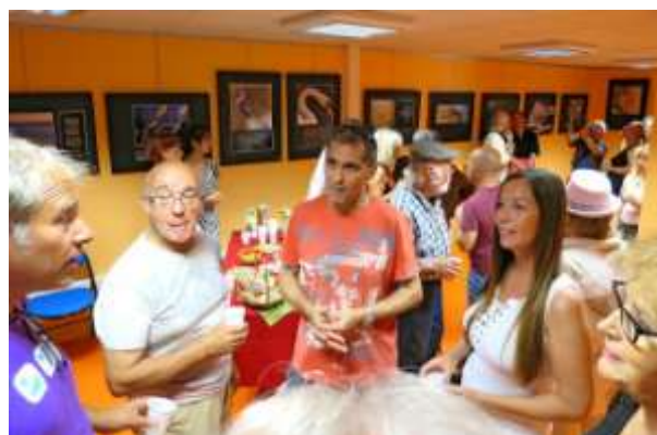
« Photos prises au mot », Bibliothèque Fontaine du Temple, Nice, mai 2014