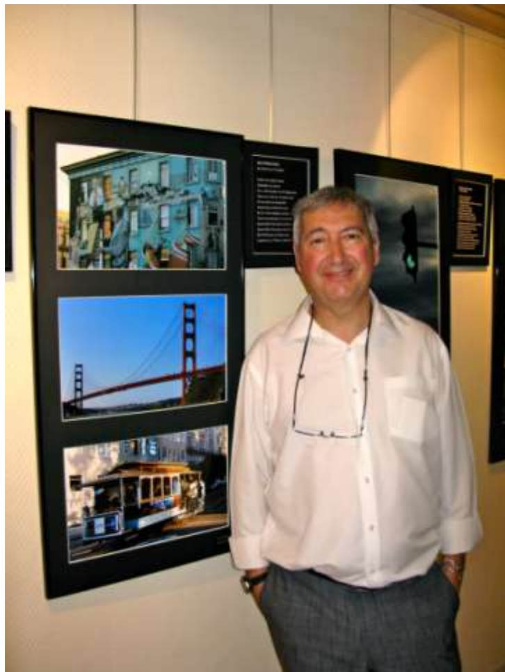
« Musigraphie », Forum Nice-Nord, Nice, mai 2014