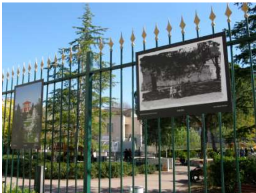
« Parenthèse Verte », Jardin Gorbella, Nice, mars 2014