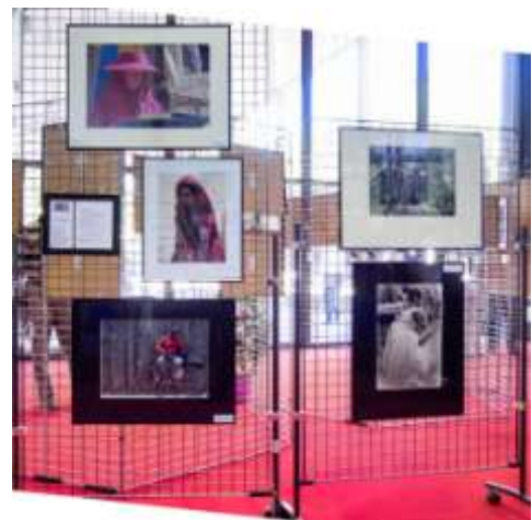
« La Patagonie » et « L'Humain », Mouans-Sartoux, mai 2014