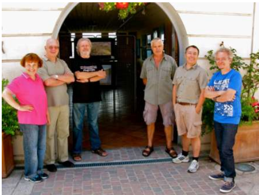
« Mercantour », Belvédère, juillet 2014