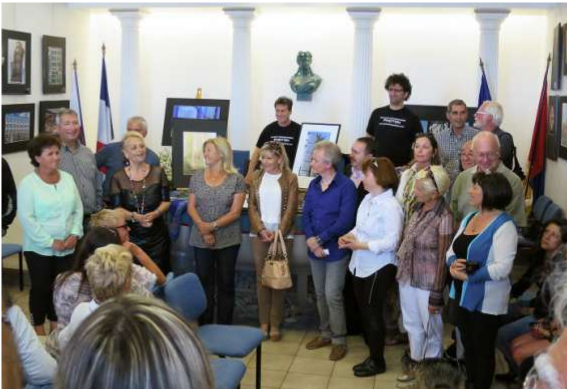
« Urban City », Cros de Cagnes, mai 2014