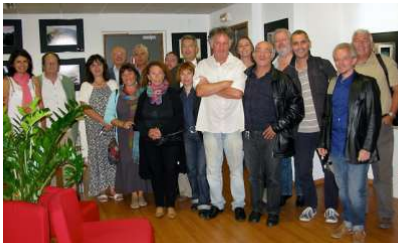
"Villages" Médiathèque de La Trinité, octobre 2013