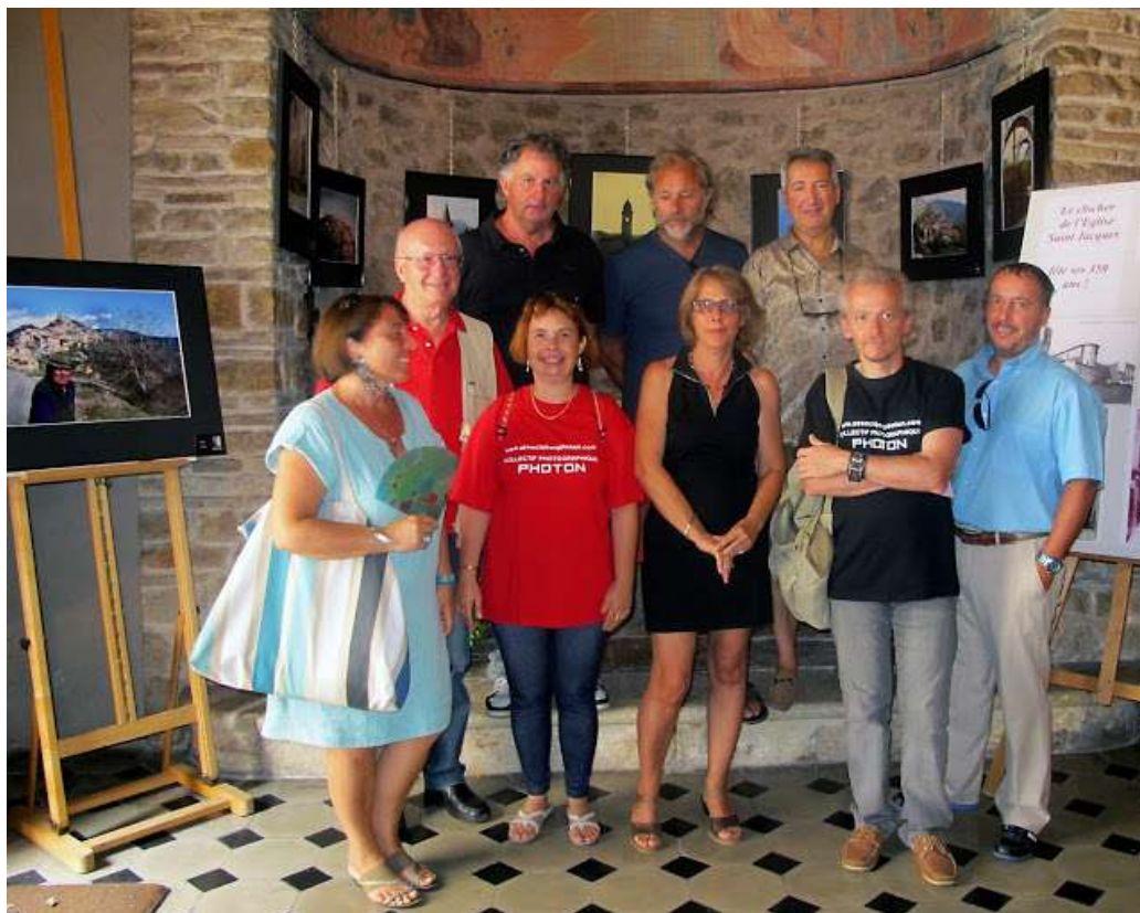
« Villages » Eglise St Jacques, La Colle sur Loup, septembre 2013