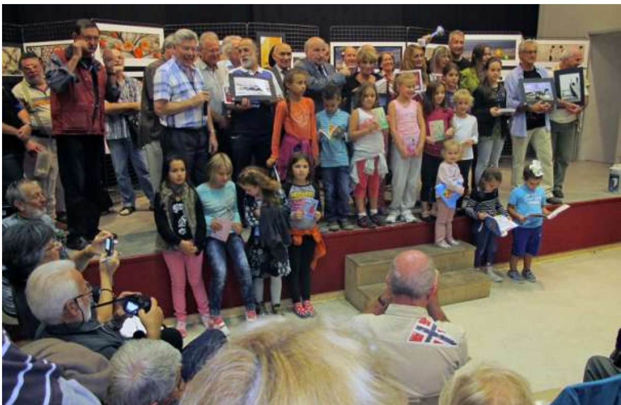
1 er prix concours inter-club avec Objectif Image Nice, Tourettes-Levens, octobre 2013