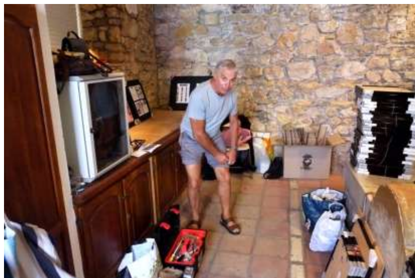
« 4X4 » Lavoir de Mougins, septembre 2013