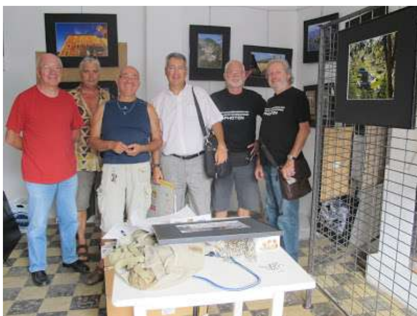
« Villages » Presbytère de La Colle sur Loup, septembre 2013