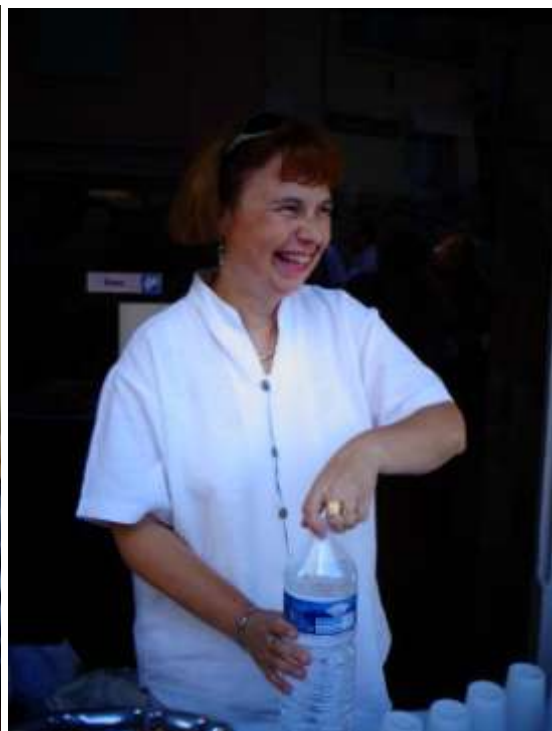
« 4X4 » Lavoir de Mougins, septembre 2013