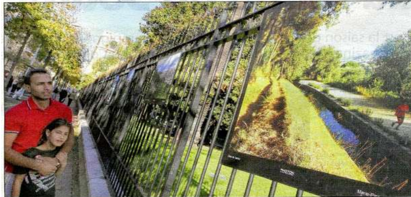
Une invitation à découvrir les flots de verdure niçois.