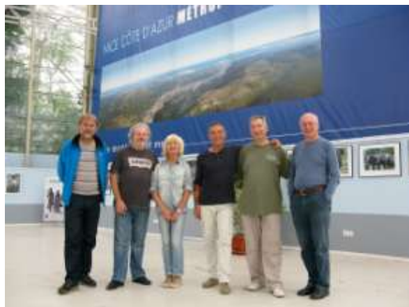
"Afrique du Sud", Explorimages, Parc Phoenix Nice, novembre 2013