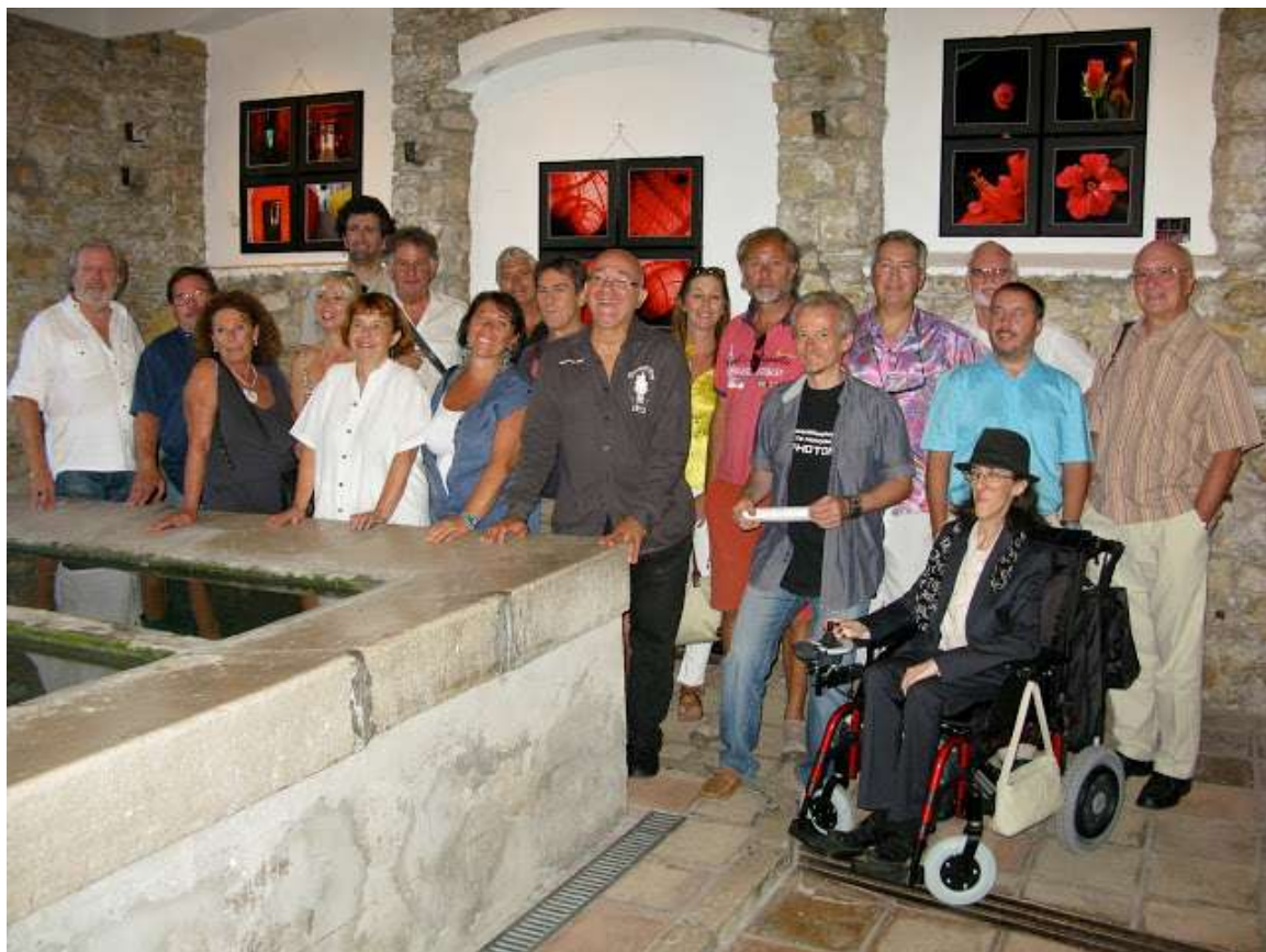
Vernissage « 4X4 » Lavoir de Mougins, septembre 2013