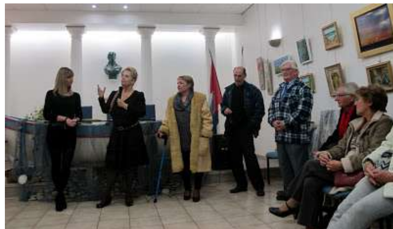
CAGNES SUR MER, décembre 2012, « Vernissage des exposants »