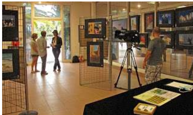
PARC PHOENIX, septembre 2012, « NISSA »