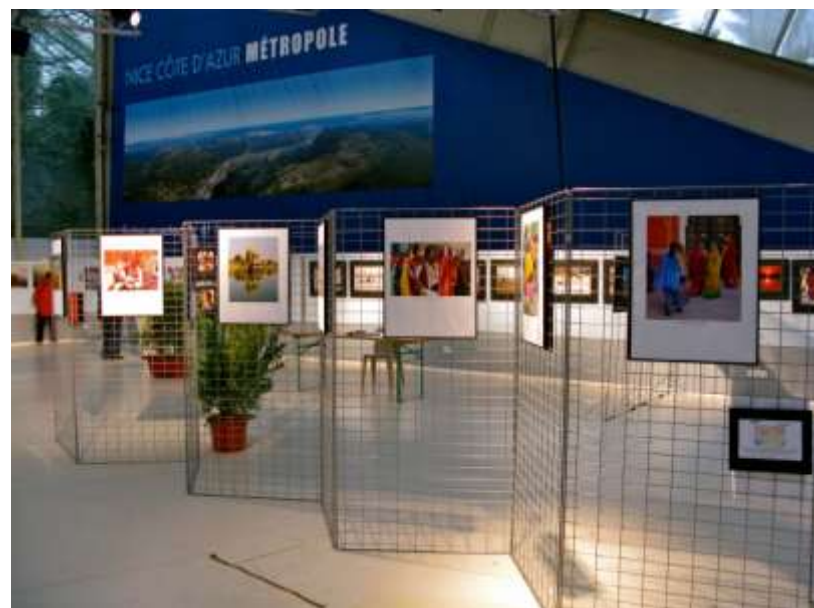
EXPLORIMAGES, novembre 2012, « COULEURS D'INDE »