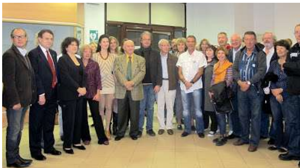
FALICON, octobre 2012, « OMBRES ET LUMIERES »