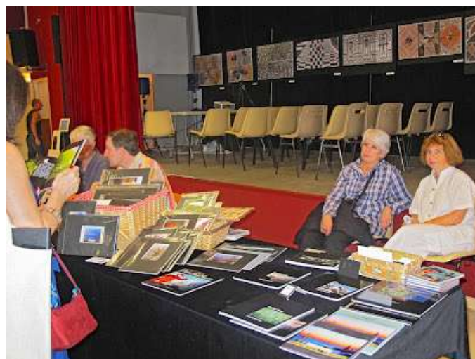
TOURRETTES LEVENS, octobre 2012, « OMBRES ET LUMIERES »