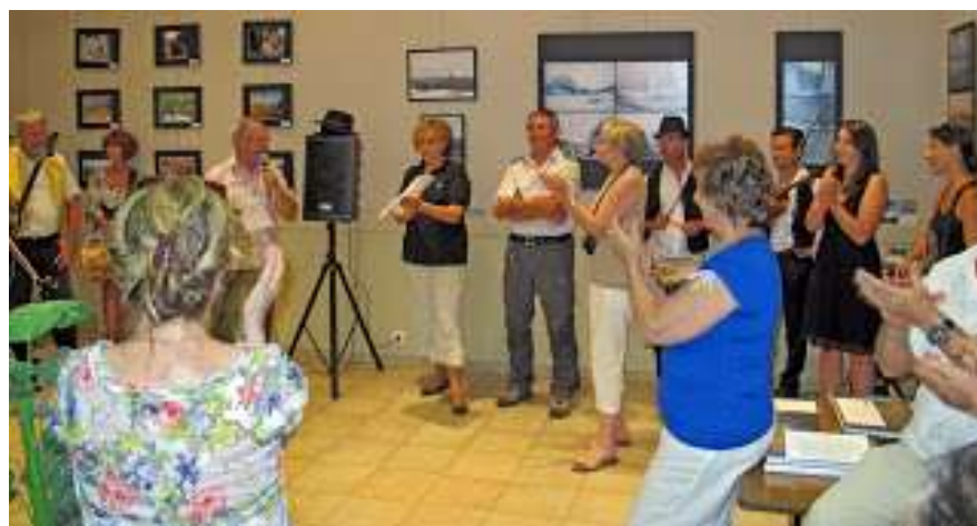
ST SAUVEUR, juillet 2012, « LA PATAGONIE »