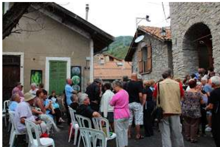
VENANSSON, août 2012, « VEGETAL EMOI »